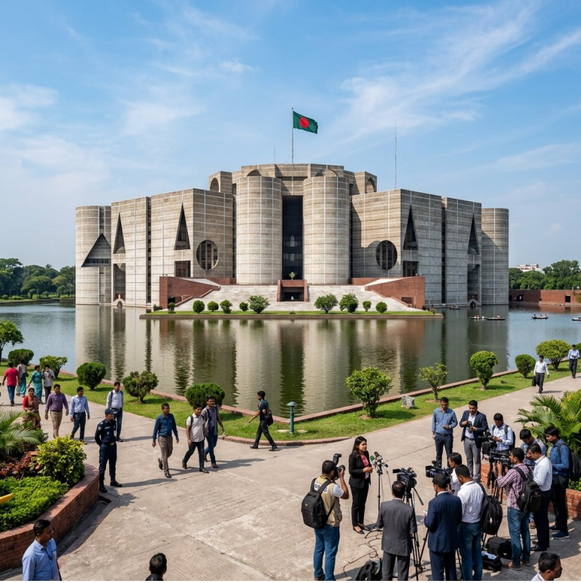
কৃত্রিম বুদ্ধিমত্তা ব্যবহারে নতুন নীতিমালা হচ্ছে প্রযুক্তির অপব্যবহার রোধ ও উদ্ভাবন উৎসাহিত করতে এই উদ্যোগ।