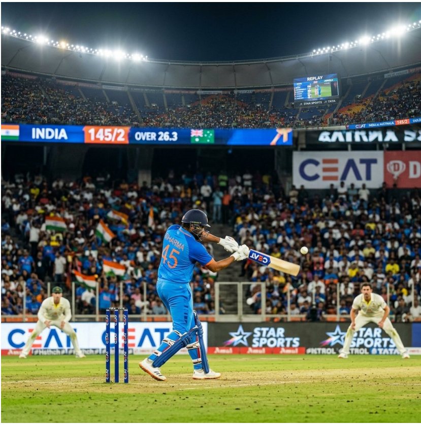
ডিজিটাল ব্যাংকিং সেবায় গ্রাহকদের আগ্রহ বাড়ছে যদিও বসেই লেনদেনের সুবিধা প্রান্তিক পর্যায়ে পৌঁছে ব্যাংকগুলো।