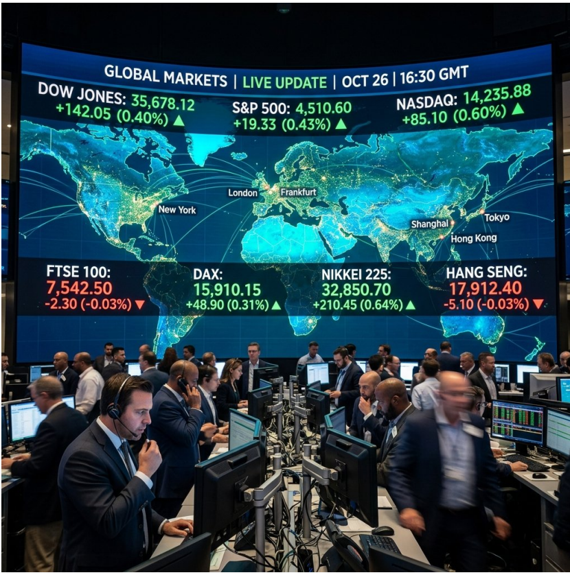
চা শিপ্পের উন্নয়নে বিশেষ প্যাকেজ ঘোষণা সরকারের রত্নানি বাড়াতে ও শ্রমিকদের জীবনমান উন্নয়নে নেওয়া হয়েছে দীর্ঘমেয়াদী পরিকল্পনা।